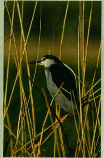
Gece balıkçılı ( Nycticorax nycticorax )

olan Türkiye'de de kuş gözlemciliği son beş yılda hızla arttı. Doğa Derneği ve birçok yerel kuş gözlem topluluğunun çabaları bu artışın destekçileri oldu.